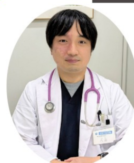
八百 壮大 医師 JCHO横浜保土ヶ谷中央病院 総合診療科医長 横浜市立大学医学部臨床准教授