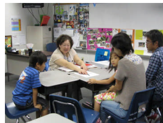
小3 C 縄手学級