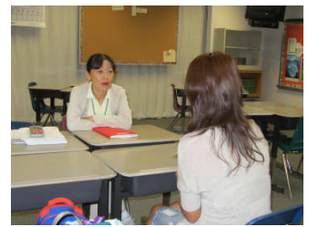
小4 A 山鹿学級