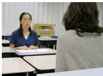
小6 B カルデロン学級