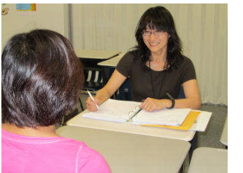
小5 A 岡崎学級