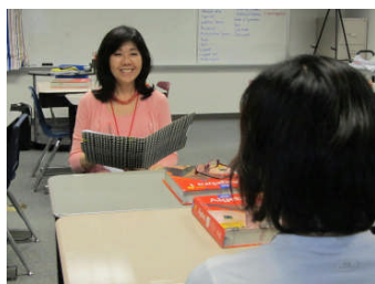
小6 A 小松学級