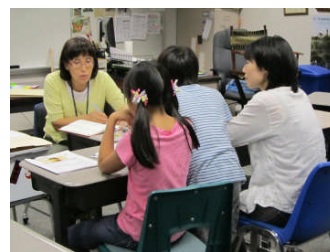
小3 A 安田学級