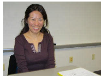
小4 B 樽谷学級