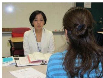
小5 B 和田学級