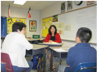
中1 A 土本学級