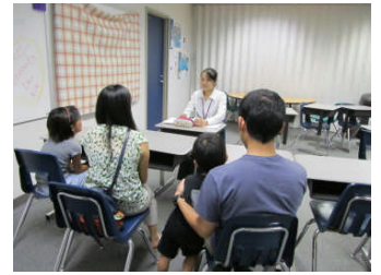
小3 B 大津学級