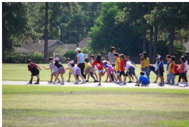
(リレー、バトン渡しの練習)