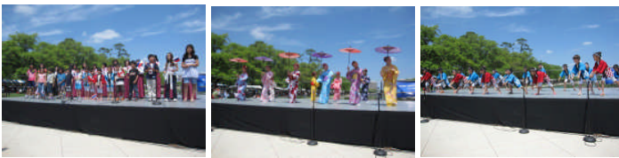
本校子どもたちの合唱と舞踊(上)