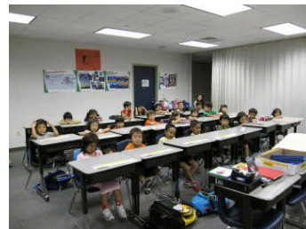
(幼稚園部星組・宙組)

職員朝礼で先生方に「すごい暑さですから児童生徒の体調維持に留意してください」「カフェテリア等に移動し、協力して授業を成立させてください」と無理を承知でお願いしました。