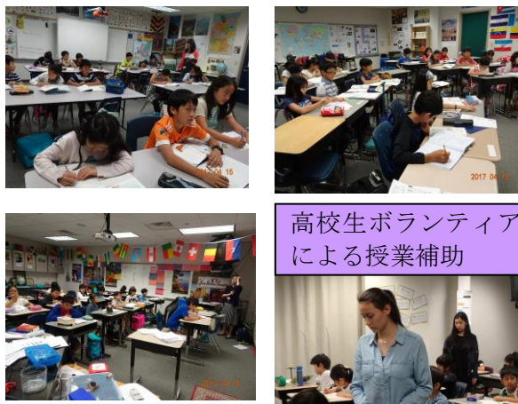
高校生ボランティアによる授業補助