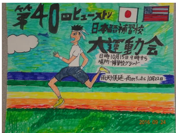
優秀賞 仙石快斗 (4年A組)