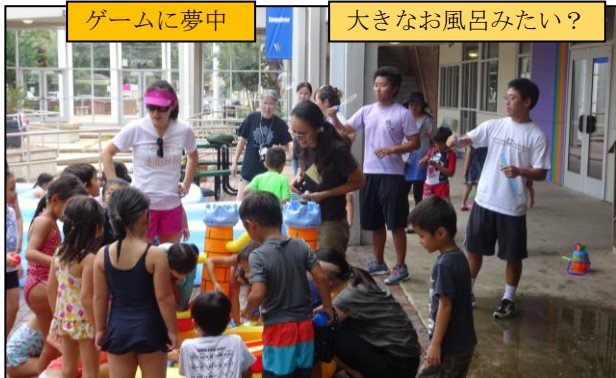
大きなお風呂みたい？