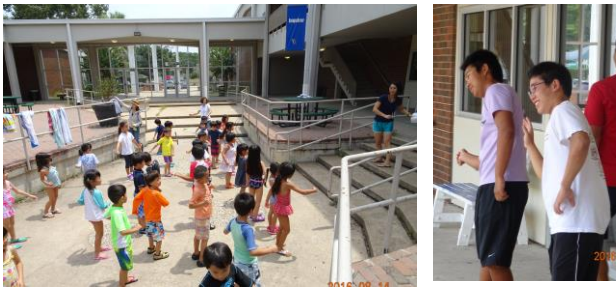
準備体操の様子（高校生ボランティアも一緒に体操）

8月13日、中庭に子供用のプールを設置して、今年度2回目の水遊びを行いました。水遊びの道具やシャボン玉用具等でも遊びました。暑い日射しの中、大はしゃぎでした。保護者ボランティアの皆様にはお礼申し上げます。