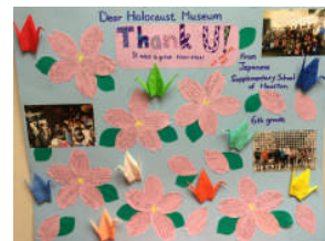
子どもたちからのお礼の寄せ書き