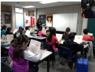
←小4B 伊藤先生 研究授業