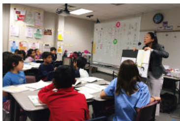
2C デイリー先生研究授業

本補習校は、「日本の教育体系での学びの継続性の保障」「キャリアとしての日本の教育の履修」ということを見据えて日々の授業に臨んでいます。そのために、当然のことながら授業力を高めていかなければなりません。教員にとって、一人一人の子供を多面的に、しっかりとらえ、身に付けたい知識・技能や思考力・表現力、学びの力を見据えて、ねらいに即して授業を充実させていく授業力を高めるため、研究授業は非常に大切なものです。