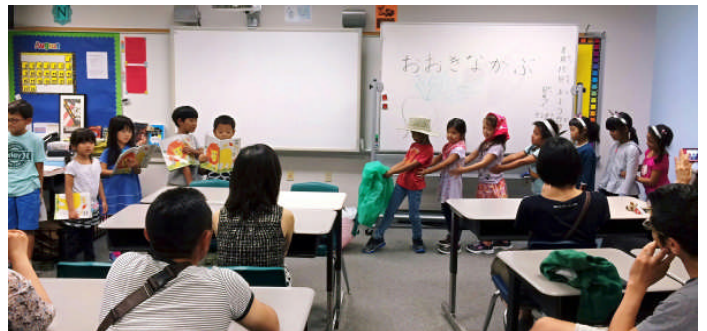
小1年 「おおきなかぶ」音読劇