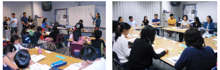
A組参観授業と学級懇談会