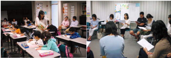
A組参観授業と学級懇談会