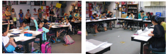
B組参観授業と学級懇談会