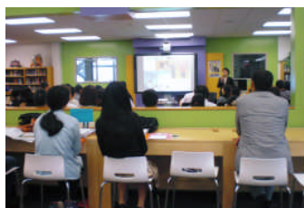
参加校プレゼンテーション