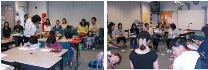
B組参観授業と学級懇談会