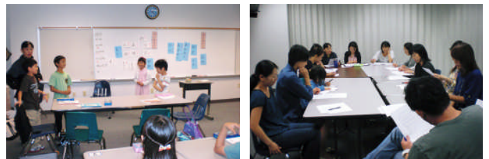
B組参観授業と学級懇談会