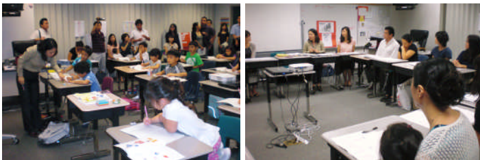
C組参観授業と学級懇談会