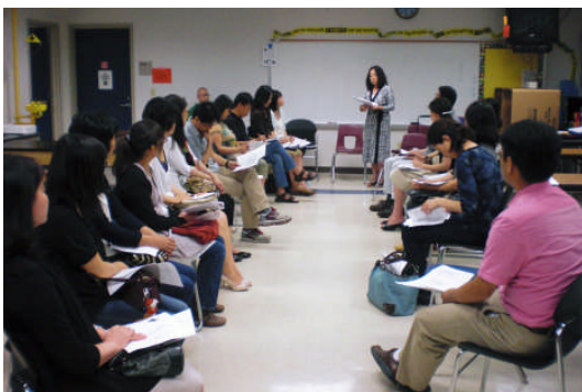
高等部 (1～3年) 学級懇談会