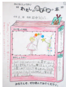
→ 4A 掲示から