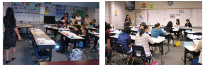
C組参観授業と学級懇談会