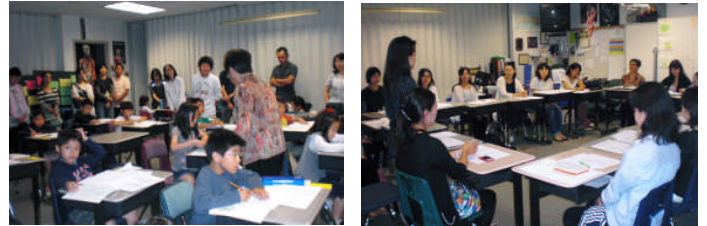
A組参観授業と学級懇談会