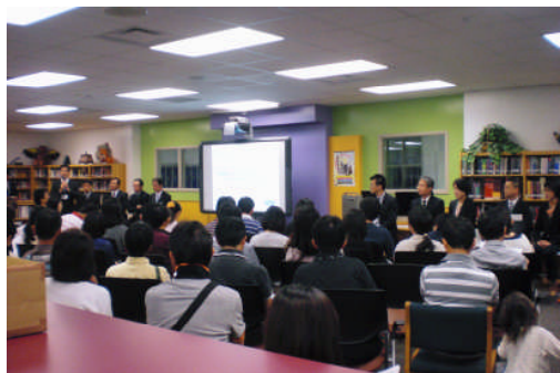
参加校担当者によるパネルトーク

5月31日には、SAPIXの「2014 前期帰国入試進学セミナー」（中学・高校・大学の3部に分かれての講演会）も開催する予定です。こちらに関しては、5月3日配布の案内資料、または、SAPIX中学部ホームページ ( http://www.sapix.co.jp )をご覧ください。