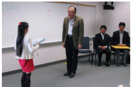
「感想とお礼」作文集贈呈