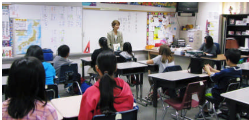
中学部入学説明会

そういった観点で、具体的な学習の様子、家庭学習課題の内容や進め方、準備物や諸注意事項について説明をしました。