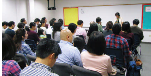
小学部入学説明会

帰国後の生活を考え、日本での学びを続けられるようにということ、将来にその子の生き方に重要な要素となる学びの場となることを期する、というものです。