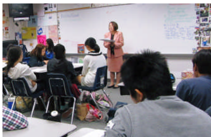
高等部入学説明会

また、放課後には、中学部説明会と高等部説明会を、こちらは子どもたちも一緒に同様の内容で行いました。