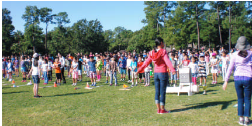
運動会予行(ラジオ体操風景)