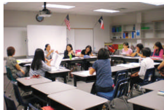
ー幼・低学年部会研究協議ー