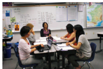
ー中・高等部会研究協議ー