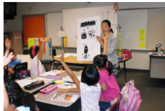
ー小2C国語公開授業ー

6校時の自習監督をお引き受け下さいました保護者の方々には、ご協力ありがとうございました。