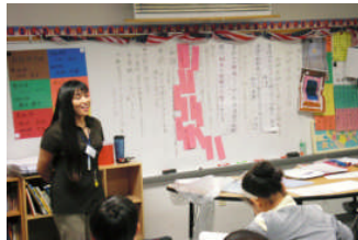
ー小5B国語公開授業ー