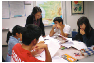
ー中3年社会科公開授業ー