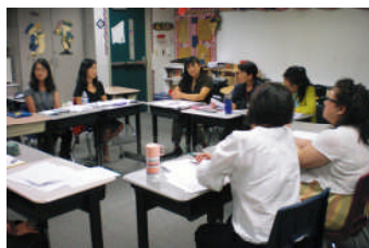
ー高学年部会研究協議ー