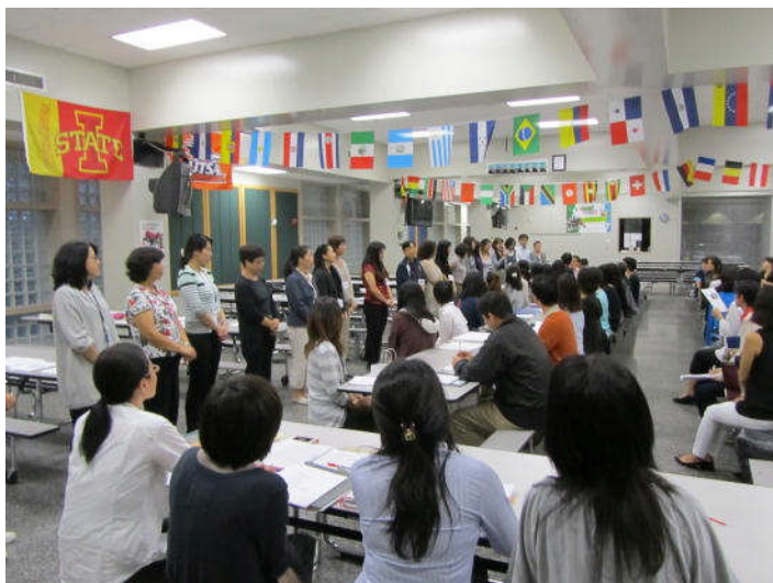
PTA総会における職員紹介