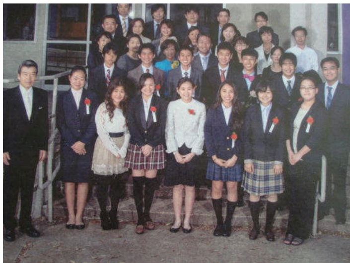
(4月 入学式当日の写真)