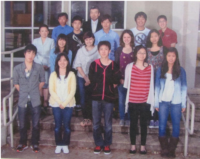
(4月6日の写真 担任 数学専科 校長も入っています)

誰ニモ負ケズ 現地校ノ授業ニモ負ケナイ 変化ニ幾度トナク倒レ 傷ダラケノ身体ニナッテモ 前ニ進ムコトヲヤメナイ 口数少ナク 決シテ驕ラズ イツモ静カニ笑ッテイル 一日三回玄米ト野菜 ミソ汁ト少シノ肉ヲ食ベ アラユルコトヲ 自分ノ都合ニ合ワセルコトナク 他人(ヒト)ノ事ダケ考エ行動シ ヨク見聞キシ分カリ ソシテ忘レズ 優シイ家族ニ囲マレテ 其方(チチ)ニ病氣ノ友ガ在レバ 行ッテ看病シテヤリ 此方(コチ)に疲レタ隣人在レバ 行ッテソノ苦ヲ取り払イ