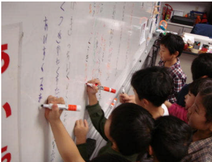
(幼稚部：こんなに書けるようになりました)

いつもと同じ教科学習の姿をご覧いただくための授業から学習発表形式の授業まで、各学級でお子さまの「学びの姿」とこの1年の「成長ぶり」をご覧いただけましたと思います。