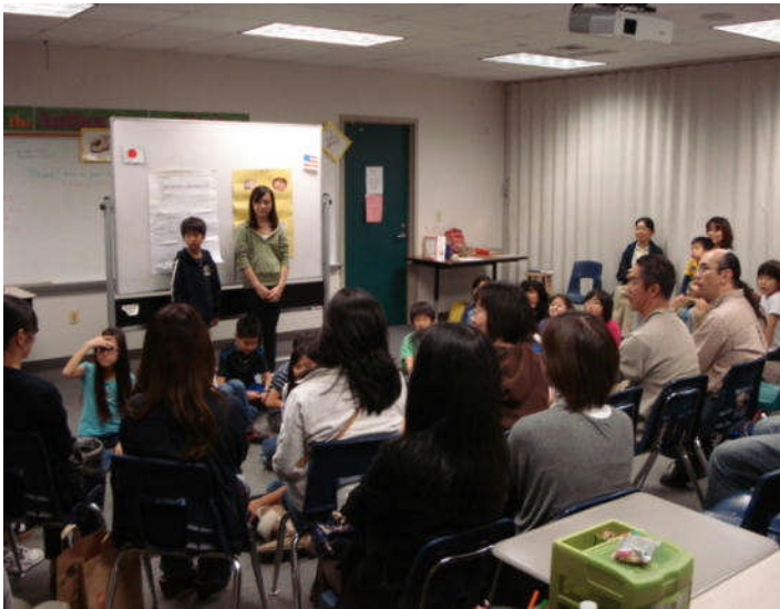
(4年：各発表に保護者からの感想が述べられました)